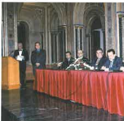
Acto de entrega de los Premios ARCHIVAL 2002