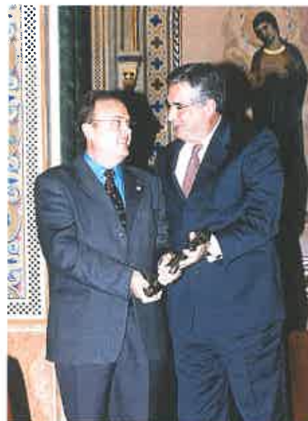
El Presidente de la F.F.C.V. y el Director Gral. de Patrimonio, en los Premios ARCHIVAL