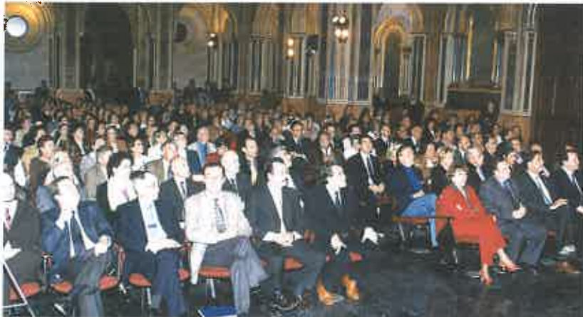
Vista general del acto de entrega de los Premios ARCHIVAL 2002

El Presidente de la Federación, agradeció este premio y manifestó que el mismo se debe al trabajo y actividad que realizan todas las asociaciones culturales, tanto federados o no, que trabajan por mantener nuestras señas de identidad.