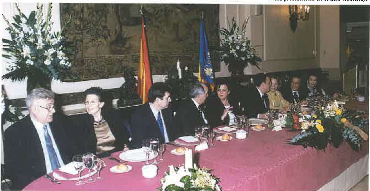
Mesa presidencial en el acto-homenaje