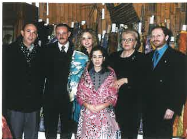
Entrega de PAÑOLONS a la Fallera Mayor, Fallera Mayor Infantil y Cortes de Honor de 2002.

Pero no es hasta esta década de los noventa, en la que dedicamos una sección única y exclusivamente al mundo de la valenciana.